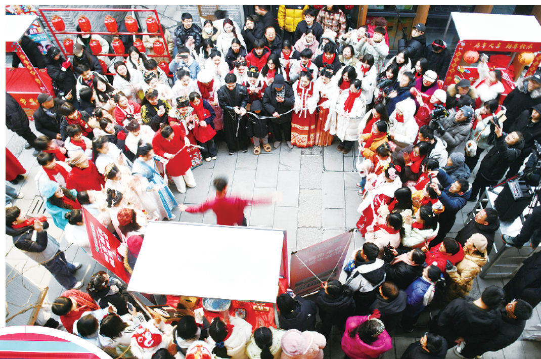
在南寨历史文化街区,传统民俗与现代文旅碰撞出绚丽火花,为“活力周口”注入浓浓的人文气息与烟火气。

潮起三川,活力奔涌。周口正以文旅为翼,以发展为笔,在高质量发展征程上阔步前行,不断擦亮城市名片,绽放独具魅力的时代光彩。