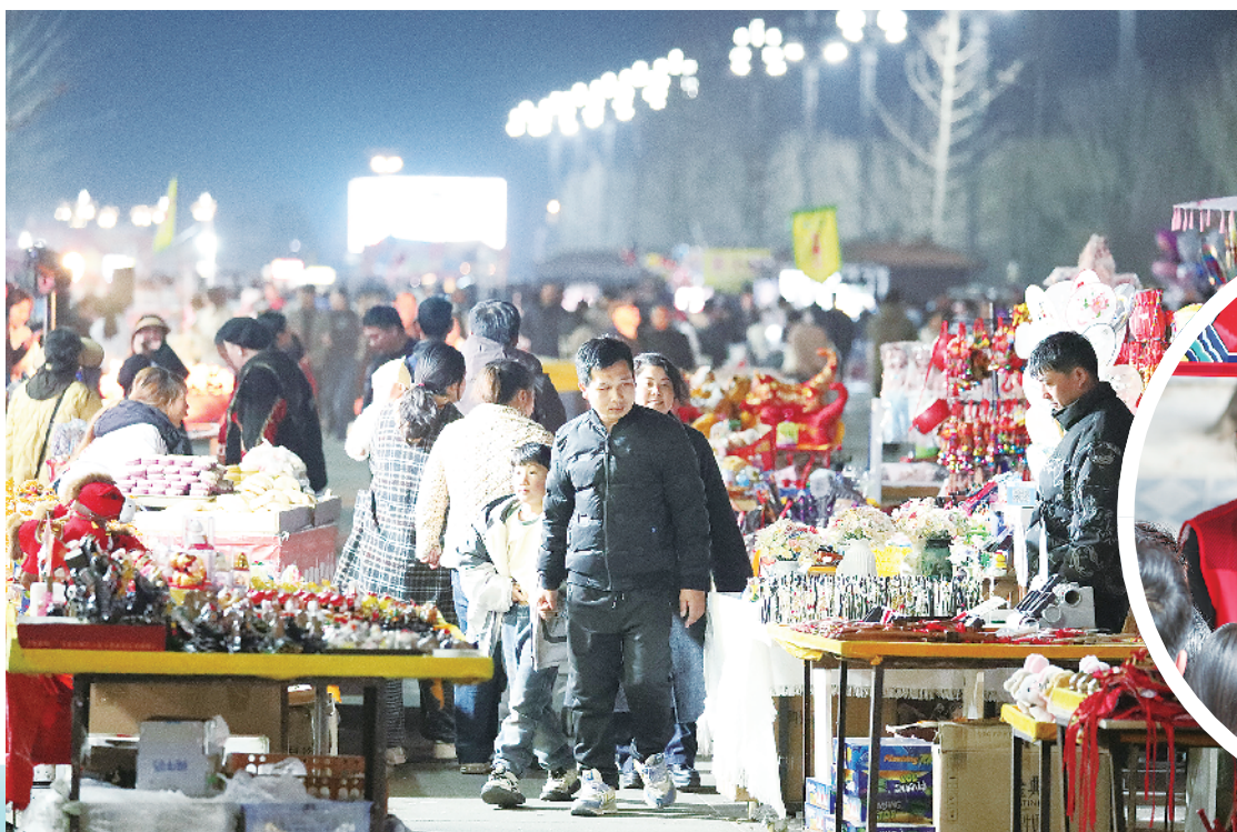
夜晚,伏羲文化广场熙攘的人群、升腾的烟火气,是“活力周口”最鲜活的注脚。