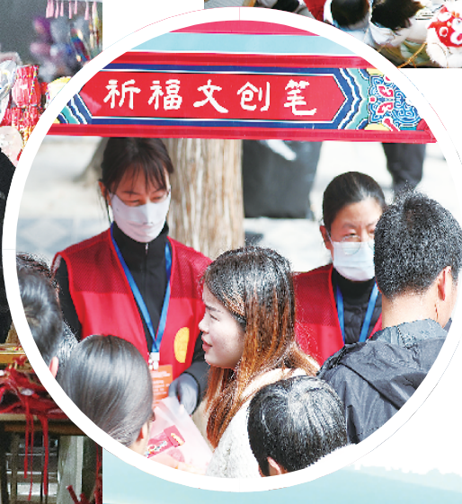
传统文化走进百姓生活,以新潮业态激活文旅新动能。