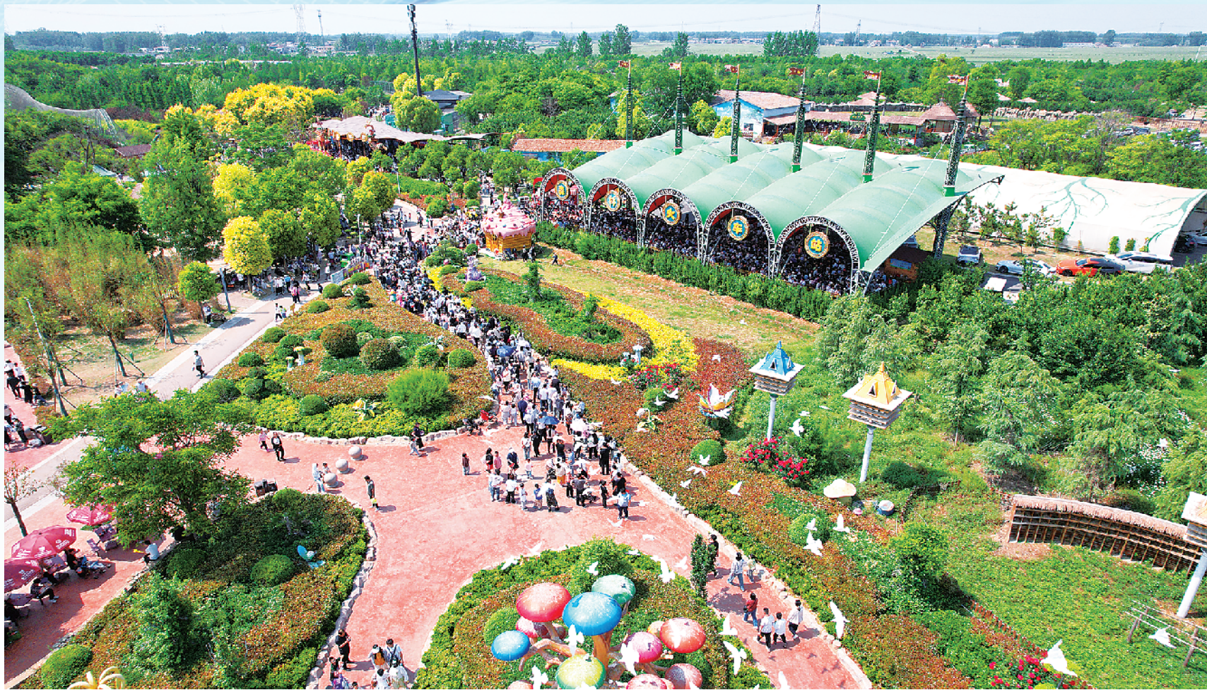
周口野生动物世界,持续引爆亲子游、周边游热潮,尽显“活力周口”生态宜居、文旅兴旺的独特魅力。