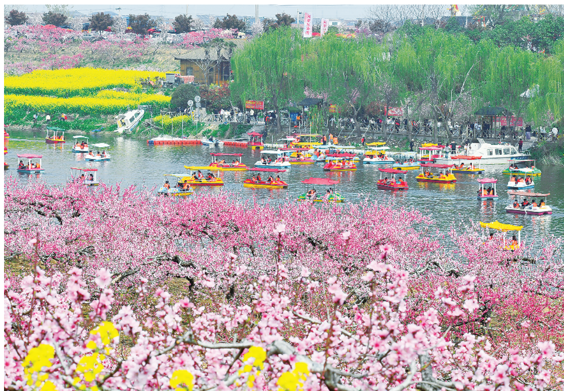
西华颍水河畔,生态与人文交融的盛景,是“活力周口”的生动缩影。